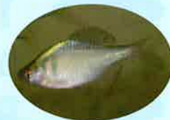
絶滅危惧種 ニッポンバラタナゴ

県立森林公園の自然池の池干しをします 網か手で魚を捕まえられるかな？ 在来種(日本固有)は放流し、外来種は駆除します。 貴重種がいるかも!ウナギが取れるかも!