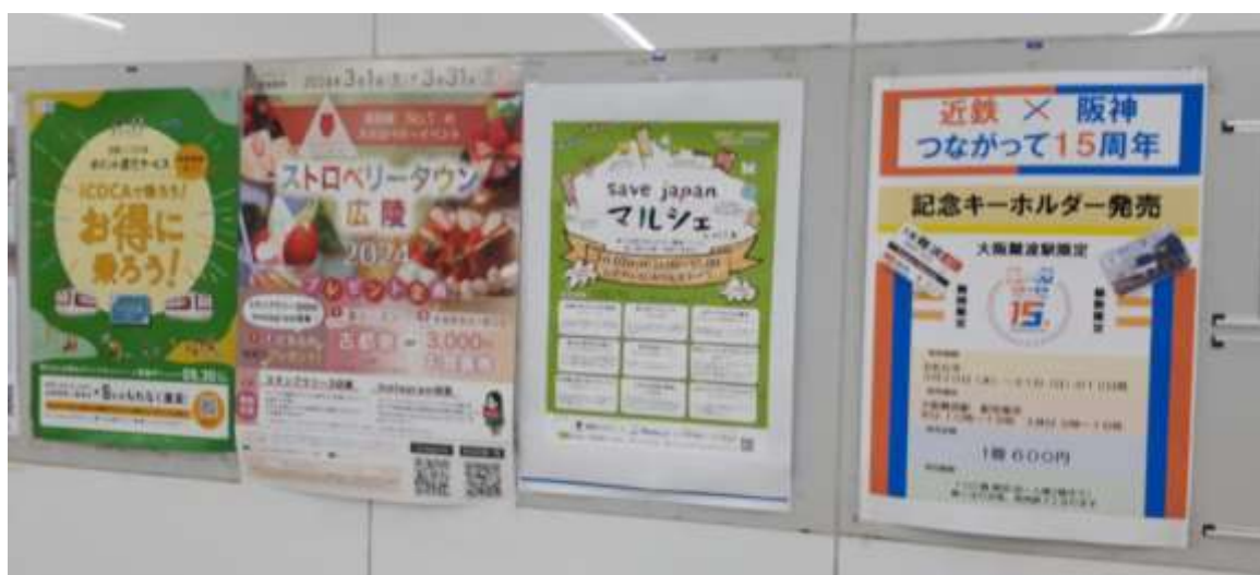
近鉄生駒駅構内への掲示