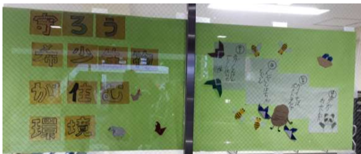
生駒市市民活動推進センターららポートエントランス窓への掲示