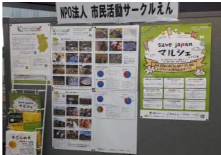
奈良市ボランティアインフォメーションセンターパネル展での展示